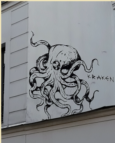
Poulpe des rues

• Exposition prolongée en janvier - Valérie Janus expose ses dessins . Librairie Lire au jardin, aux heures d'ouverture.