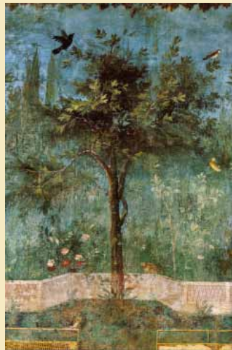
Détail de la fresque de la Maison Livie